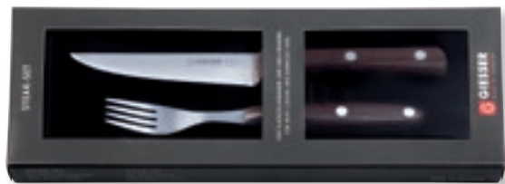
9 7 5 0-2 | STEAKBESTECK 2-tlg., Palisanderholzgriff auch erhältlich in Olivenholz und POM