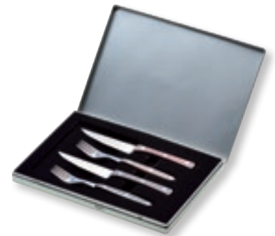
9 7 5 0 | STEAKBESTECK 4-tlg., in Aluminium-Box, Palisanderholzgriff auch erhältlich in Olivenholz und POM